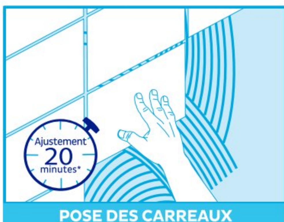
POSE DES CARREAUX

Une fois la colle appliquée sur le support, il reste 20 min environ* pour poser le carreau.