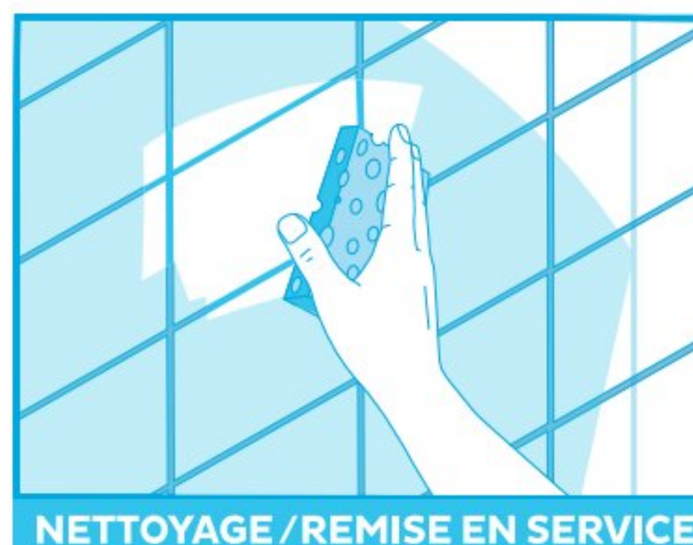
NETTOYAGE / REMISE EN SERVICE

Une fois les carreaux ajustés, retirer les croisillons et l'excès de colle dans les joints. Nettoyer les traces avec une éponge humide.